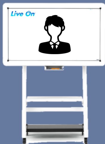
IWB D5520 55型電子黒板