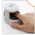
共用パソコン+ 静脈認証