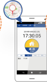
スマートフォンや タブレット端末