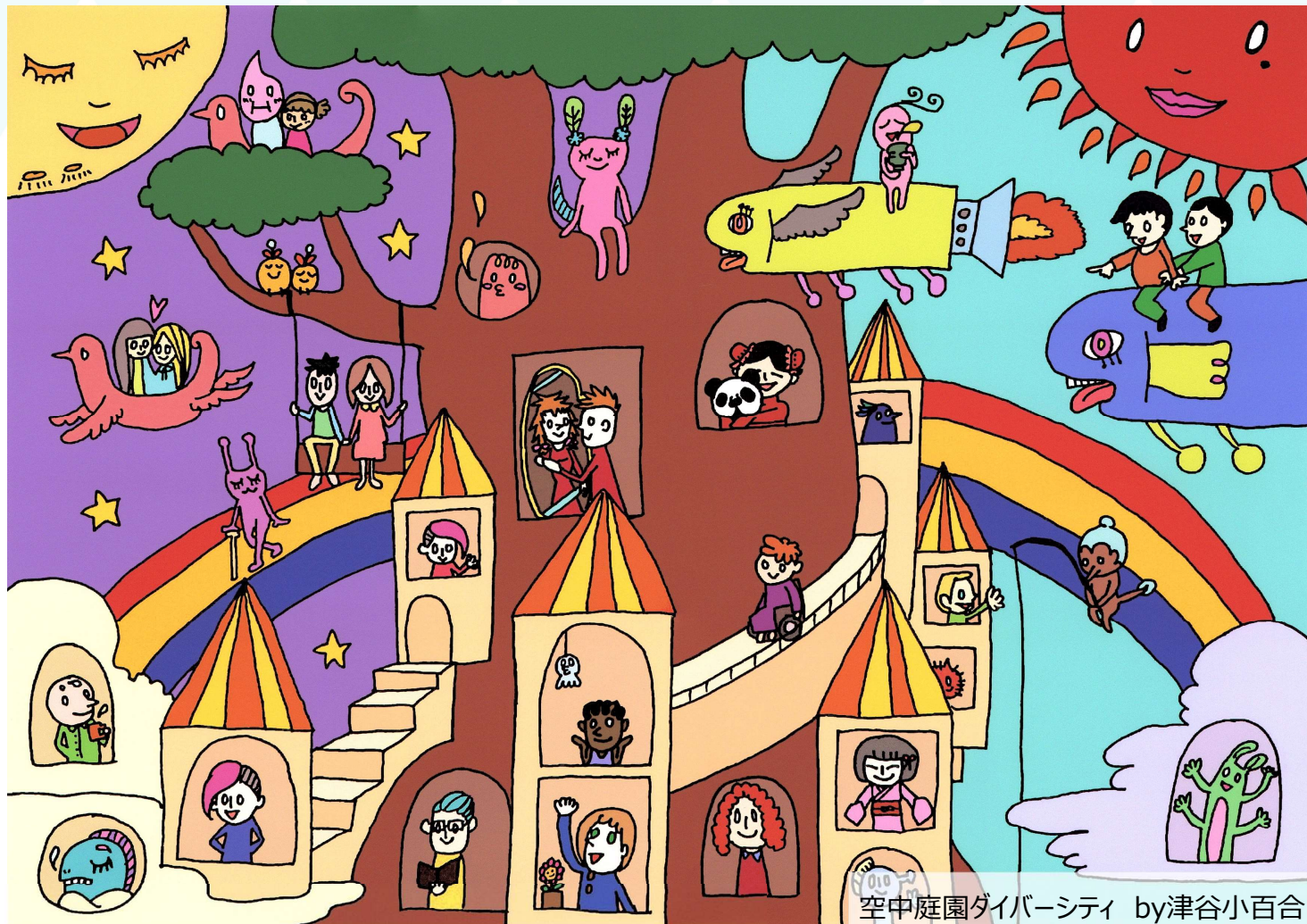
空中庭園ダイバーシティ by津谷小百合